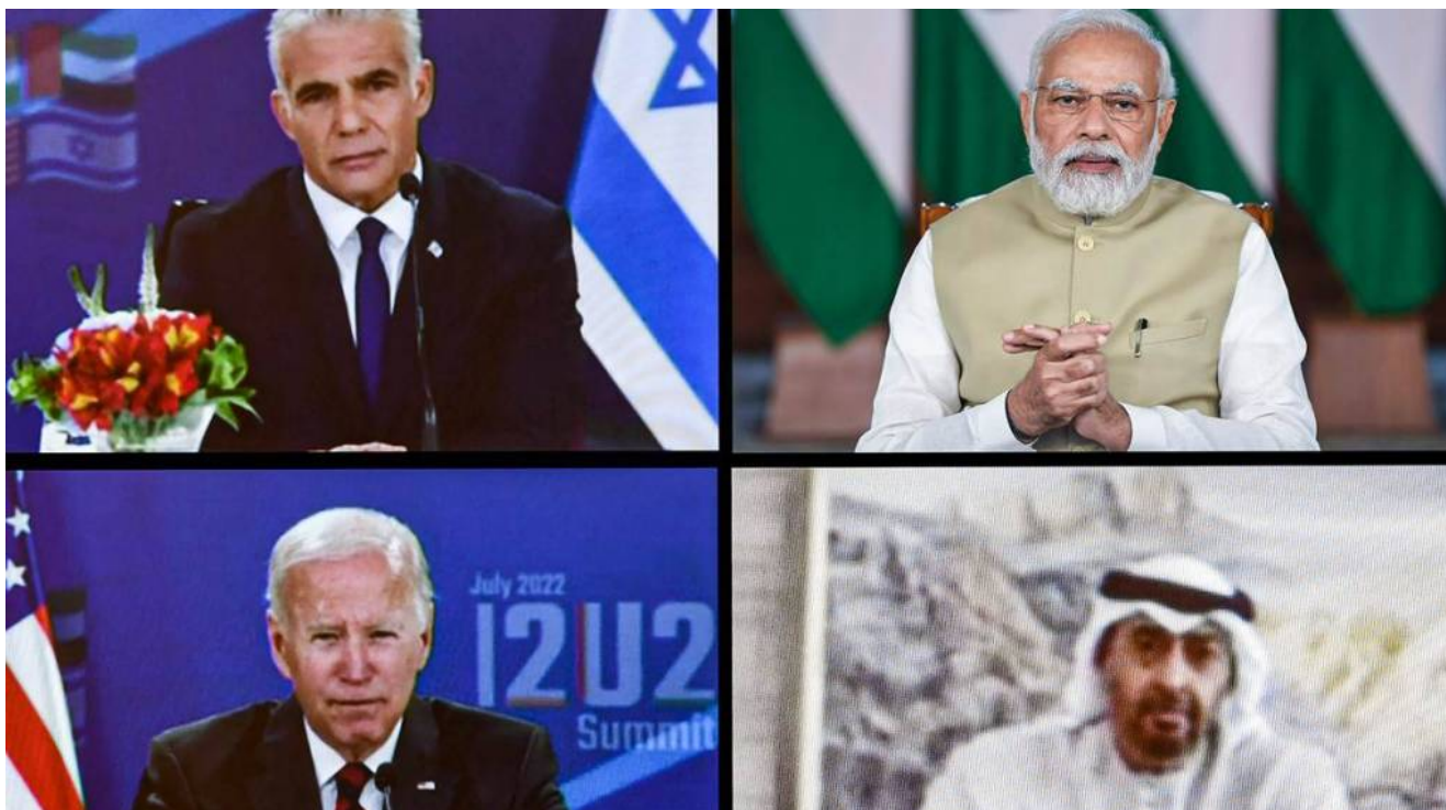
פסגת I2U2 ביולי 2022.

הפסגה של ישראל, איחוד האמירויות, ארה"ב והודו היא הזדמנות טובה לדבר על שני נושאים חשובים בגיאואסטרטגיה של ישראל: תזוזת המוקד הדמוגרפי והכלכלי העולמי מצפון האוקיינוס האטלנטי לאוקיינוס ההודי, והמקום של ישראל באגן האוקיינוס.