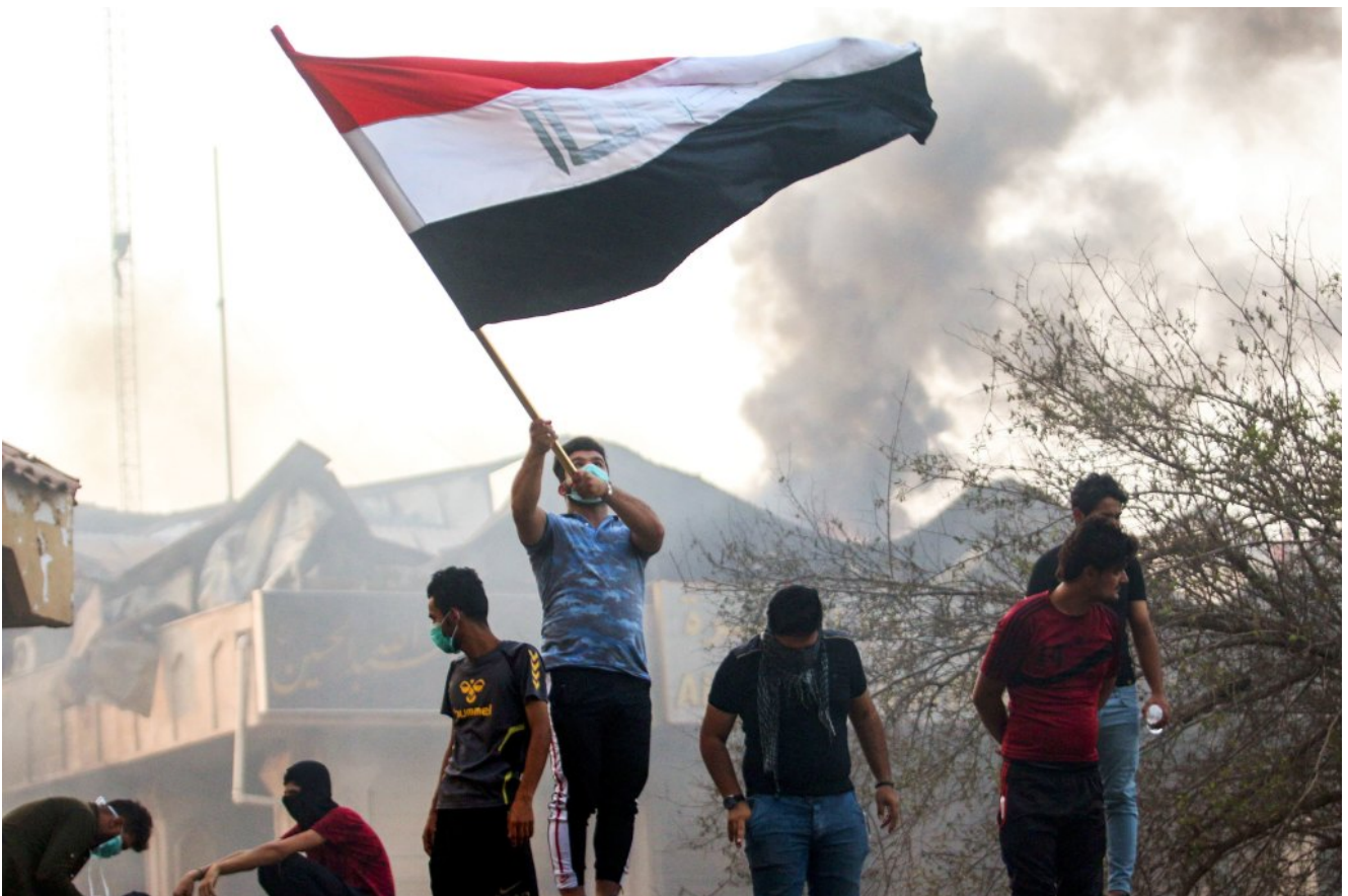
הפגנות בעיראק, 2018.

אולם מה באמת השתנה בעקבות כל התקריות האלה? המדינה הלבנונית נמצאת בתהליך קריסה , אך כפי שהראתי בניתוח מס' 26 חיבאללה נותר עצמאי לפעול נגדנו [מקור] . מלחמת האזרחים בסוריה אפשרה לאיראן להקים בה מליציות רבות והיא כיום עובדת להקים בסוריה מערך רקטי נגדנו. הכניסה של רוסיה למערכה הצרה את צעדיה איראן, אך ברור היום שמלחמת האזרחים רק חיזקה את ציר ההתנגדות. בנוגע להפגנות בעיראק, גם היום המליציות השיעיות פעילות ומאתגרות את המדינה העיראקית [מקור] .