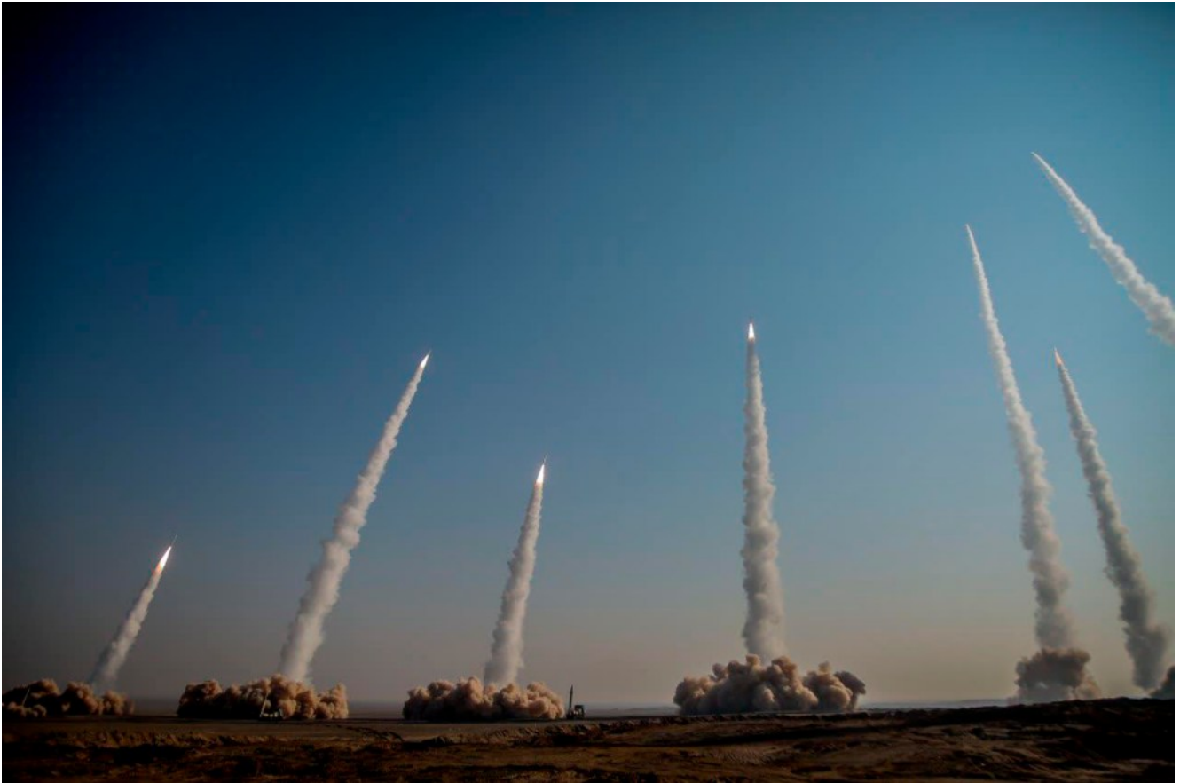
תרגיל שיגור טילים בליסטים באיראן, ינואר 2021.